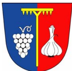
Obec Dolní Němčí