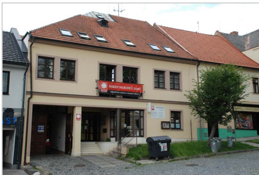
Oblastní charita Uherský Brod: Budova ředitelství