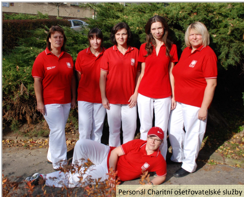
Personál Charitní ošetrovatelské služby

V minulém roce byla ošetrovatelská péče poskytnuta 262 pacientům s celkovou bilancí 19 440 návštěv.