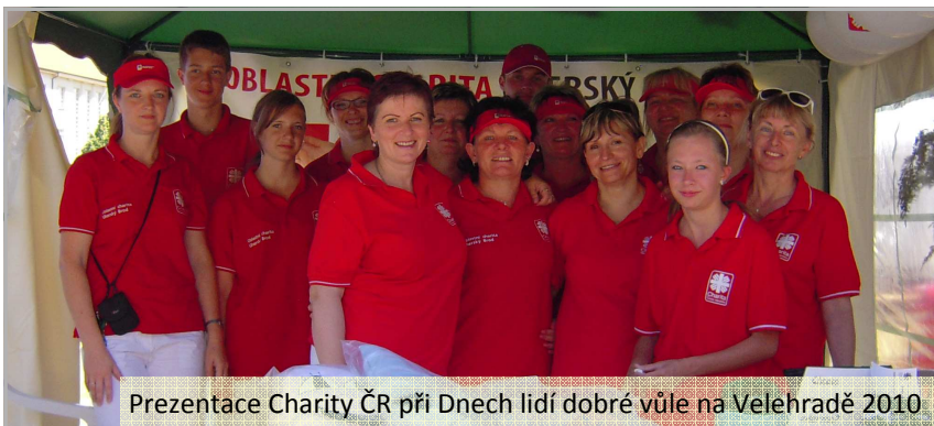
Prezentace Charity ČR při Dnech lidí dobré vůle na Velehradě 2010

Mám velkou radost z poznání, že na tuto náročnou práci nejsme sami. Těší nás stále větší počet dobrovolníků, příznivců a podporovatelů, kteří nám svou nezištností a zájmem pomáhají budovat charitní dílo. S otevřenou náručí vítáme každého, kdo může svým způsobem pomoci přímo, anebo prostřednictvím naší Charity, těm, kteří pomoc jiných potřebují. A formy pomoci mohou být velmi různorodé – povzbuzení dobrým slovem, radou či dobrým nápadem, modlitbou, návštěvou nemocných,