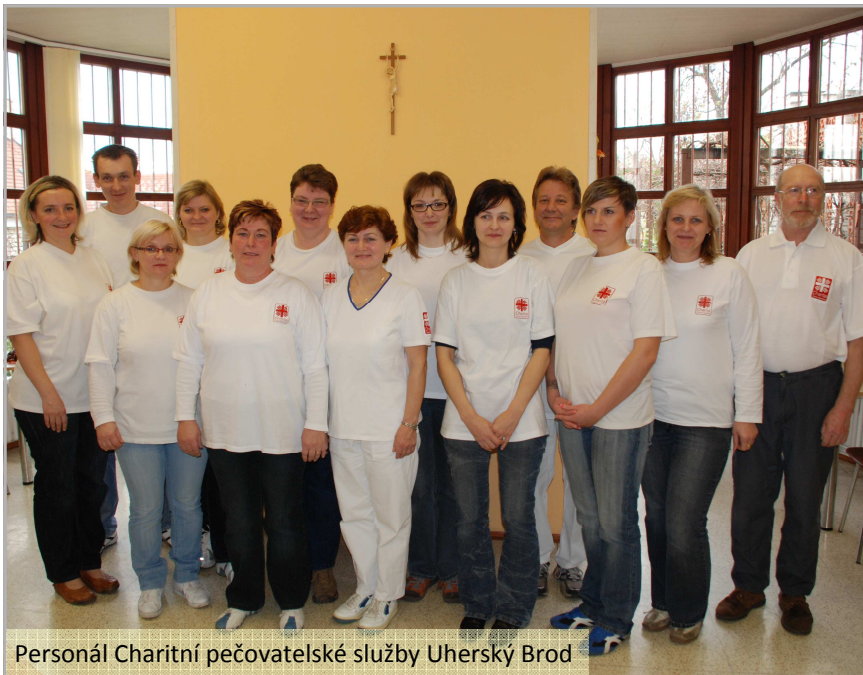
Personál Charitní pečovatelské služby Uherský Brod

Z Tříkrálové sbírky se podařilo mimo výše jmenované pomůcky zakoupit vozidlo Renault Kangoo, které slouží potřebám nejen Charitní pečovatelské služby, ale také Charitnímu domu ve Vlčnově.