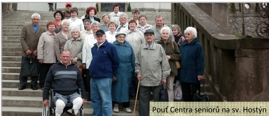
Poutě Centra seniorů na sv. Hostýn

Různorodost programů vede naše senioři k pestrému výběru a taky k lepšímu využití a trávení svého volného času. Závěrem děkuji všem přednášejícím.