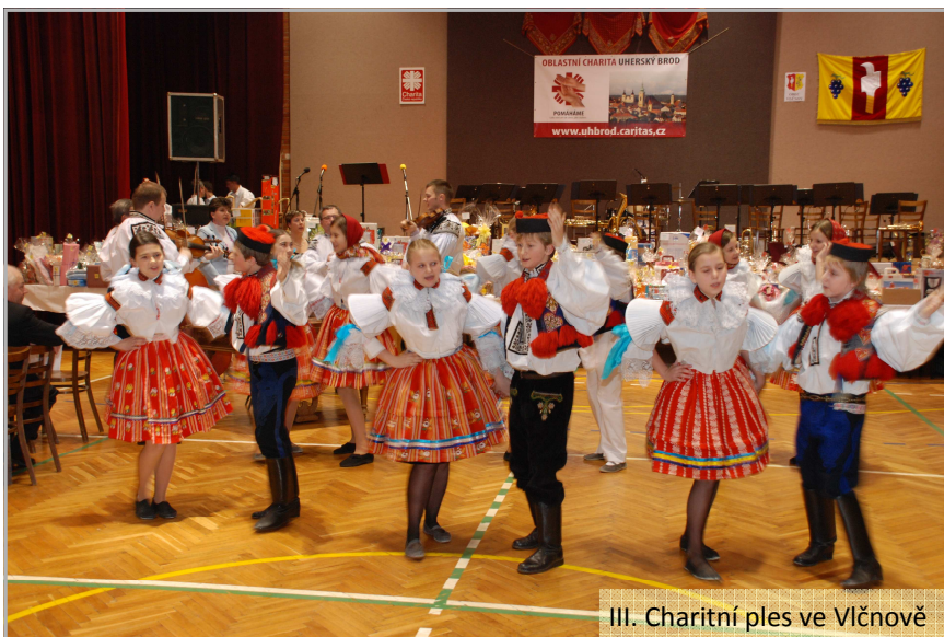
III. Charitní ples ve Vlčnově