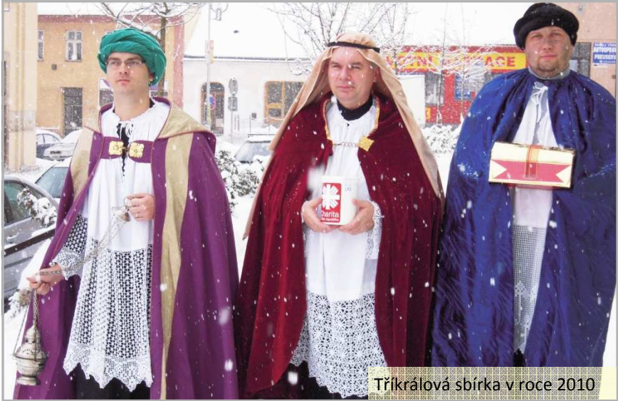
Tříkrálová sbírka v roce 2010