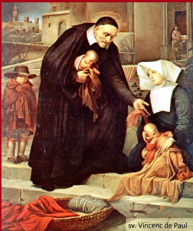
sv. Vincenc de Paul