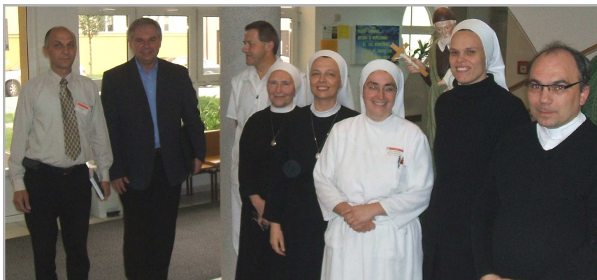
Předání daru 100.000,- Kč z výtěžku Postní almužny v Nemocnici milosrdných sester sv. Vincence de Paul v Kroměříži