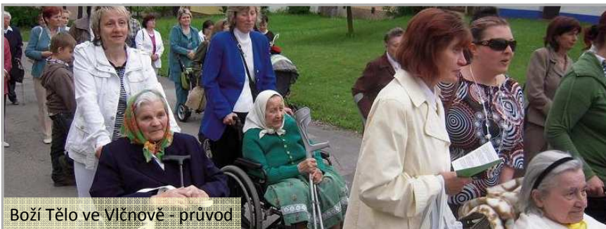
Boží Tělo ve Vlčnově – průvod

Děkujeme za spolupráci všem, kteří nám pomáhají naplňovat naše poslání.